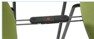
Juxtaposable en option