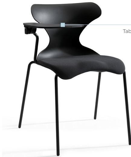
Tablette en opción